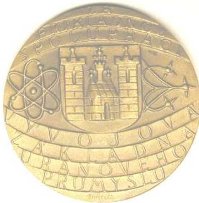
За сотрудничество в области уранового производства (Чехия)