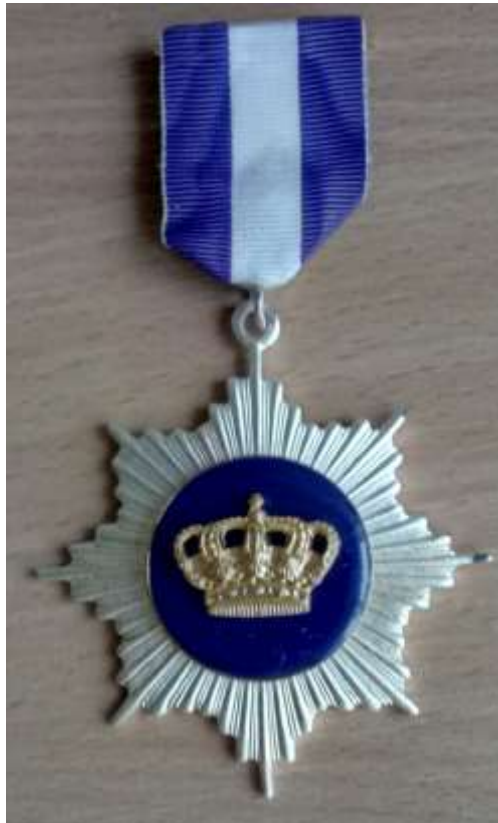
Золотая корона Европейской академии естественных наук