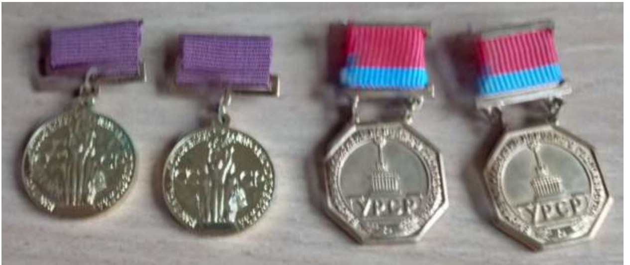
Медалі ВДНХ СССР і ВДНГ УССР